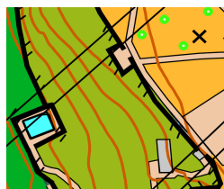
Zona con cerramiento sin paso